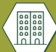
Hotellerie et immobilier