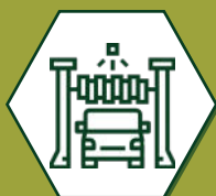
Station de lavage