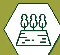
Zone rurale et agricole